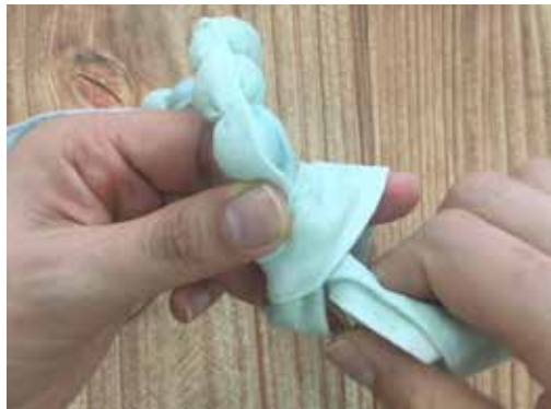
最後のビーズも結び目がきれいな面が表になるように布を通してある紐と一緒に結びます。やりづらい場合は、糸で固定してから結びましょう。