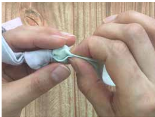
布の端の片方を広げビーズを包み、反対の端は折れた状態で被せます。