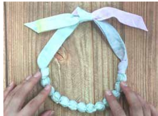
ラッピングネックレスの完成！