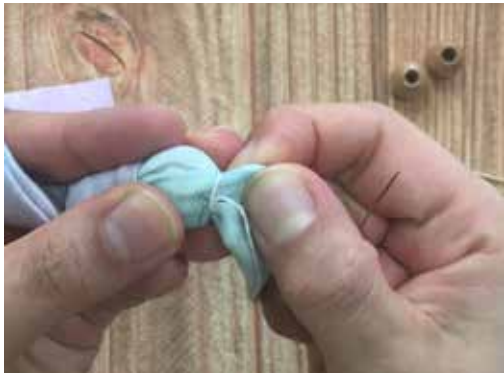
外側に出した糸を二回クルッとビーズを固定するように布を絞ります。