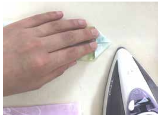
布の端を広げて三角に折りアイロンで折り目をつけます。