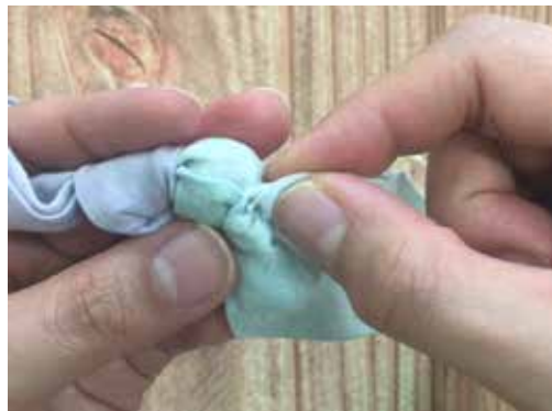
外側から糸を通し、内側で玉結びをして一つ目が完成。