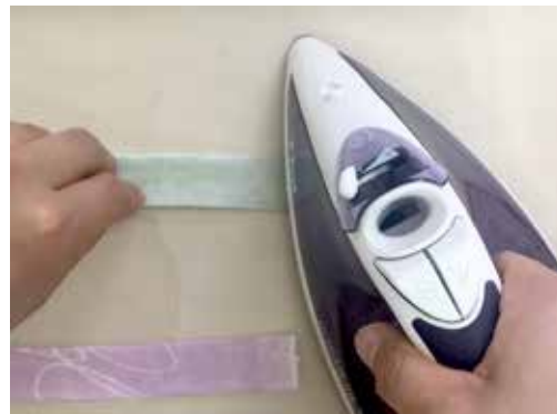
それを半分に折りアイロンをあて接着します。