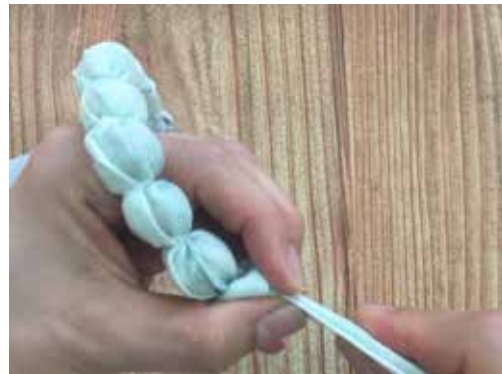
しっかりビーズに寄せて結びます。