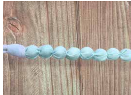
同様にお好みの数だけ繰り返しビーズを包んでいきます。