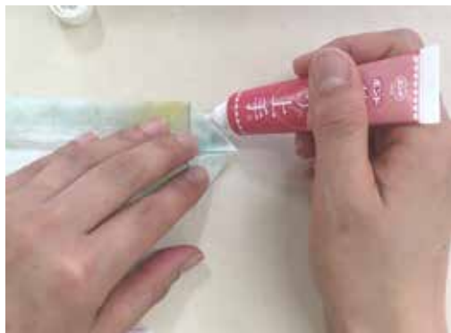
「裁縫上手」などの布用ボンドを三角部分に塗ります。